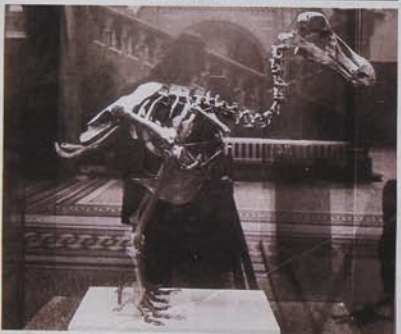
UN GRAN POLLO. Arriba, 'El dodo de Edward', pintado por Roelandt Severy en 1626, y esqueleto de esta ave en el Museo de Historia Natural de Londres. A la derecha, reconstrucción de una persecución.